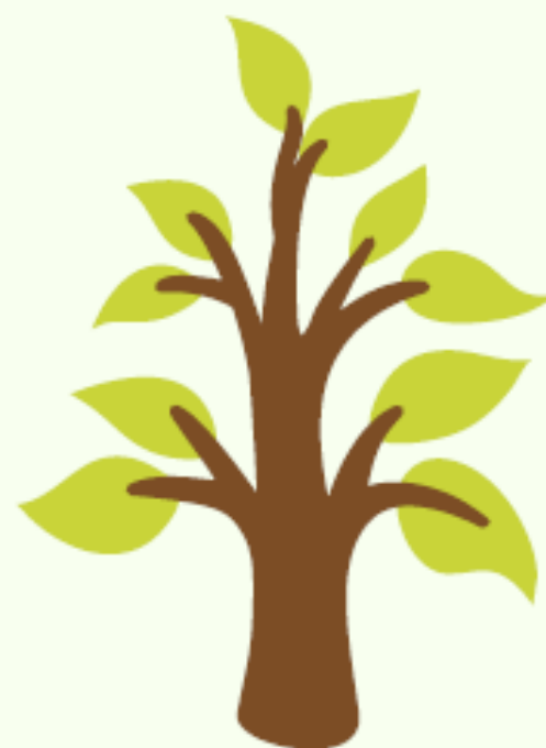
Un lieu de vie

La valeur fondamentale que nous défendons est le respect du vivant sous toutes ses formes.