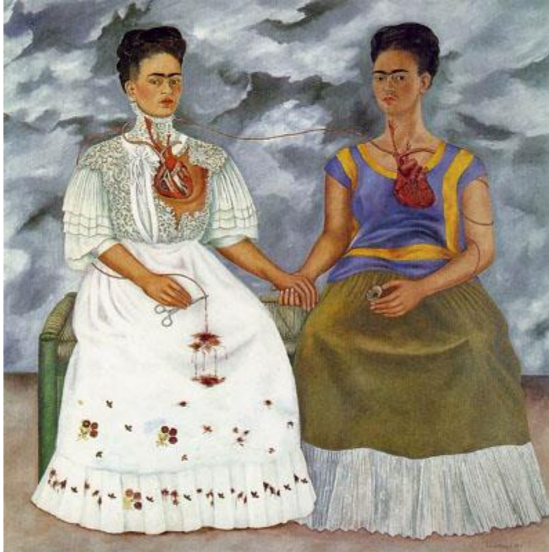
Les deux Fridas 1939

Huile sur toile - 170 x 170 cm Museo de Arte Moderno, Mexico City