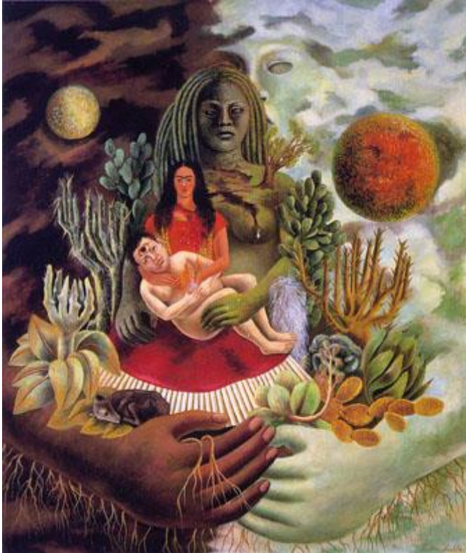
The Love Embrace of the Universe, the Earth (Mexico), Diego, Me, and Señor Xolotl