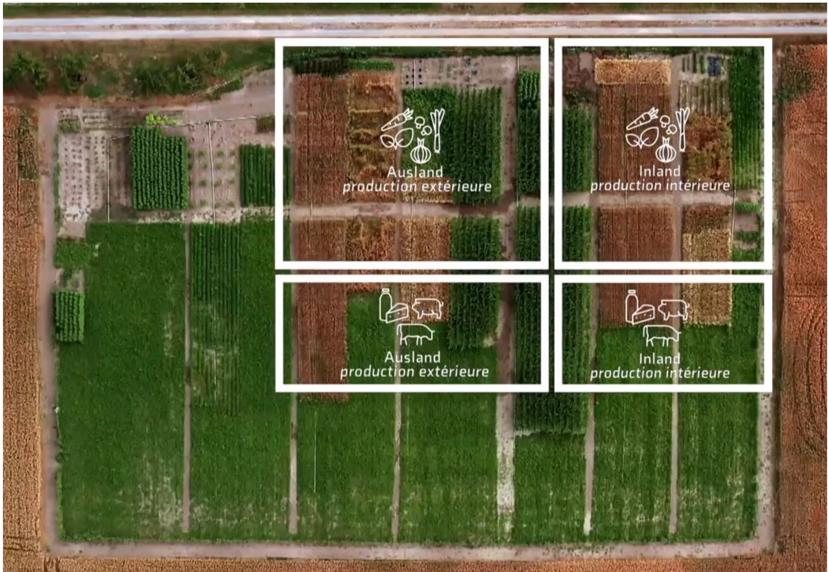
Après réduction de la part des aliments ultratransformés et/ou d'origine animale et un effort sur la consommation de produits locaux, voici la surface nécessaire par personne dans la famille test 2 (2 adultes et 3 adolescents).