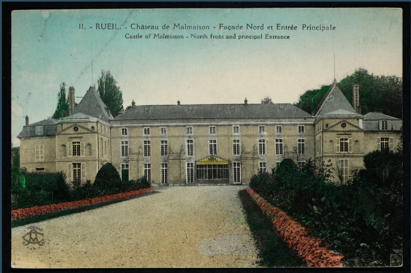
AD92 ; 9FI/RUE_589, Château de Malmaison, vers 1900.

[l'Association Nationale des Conservateurs du Patrimoine et des professionnels des Musées souhaite réaliser des interventions en milieu scolaire (QPV - Île-de-France) afin de sensibiliser aux pratiques muséales]