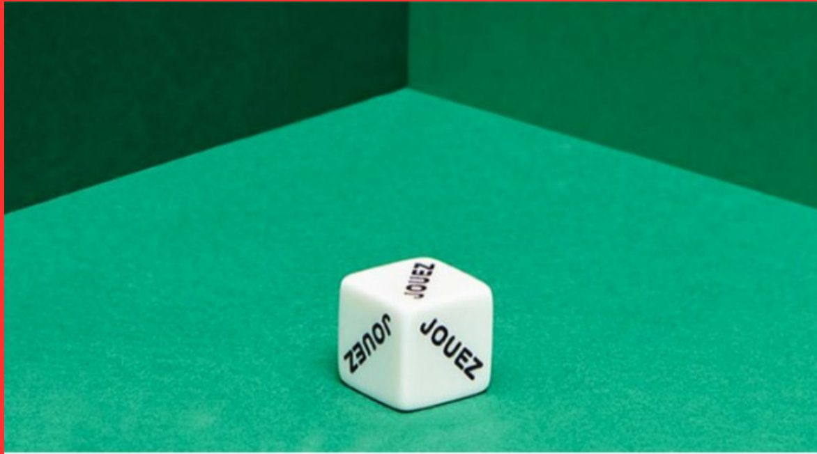
Figure majeure de l'art contemporain français, Claude Closky développe une œuvre protéiforme empreinte de questionnements sur les images qui codifient notre monde.

Dé (Joue ou Perds) (2015) est un dé comportant sur 5 faces l'indication « joue » et sur la dernière « perds ». Par le détournement d'un objet de jeu banal, Closky altère les règles. Il perturbe notre rapport à l'objet initial, et déstabilise nos habitudes. L'indication « joue » nous invite à relancer presque à l'infini le dé, sans aucune possibilité de gain. Il modifie donc le but du jeu.