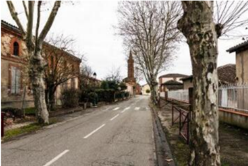
Le prieuré (à gauche) depuis la rue de la mairie.

L'espace fait 200m 2 en rez-de-chaussée, mais dispose aussi d'un extérieur en contour de 500m 2 . La réhabilitation de l'espace veillera à être accessible et inclusive afin d'accueillir le plus grand nombre.