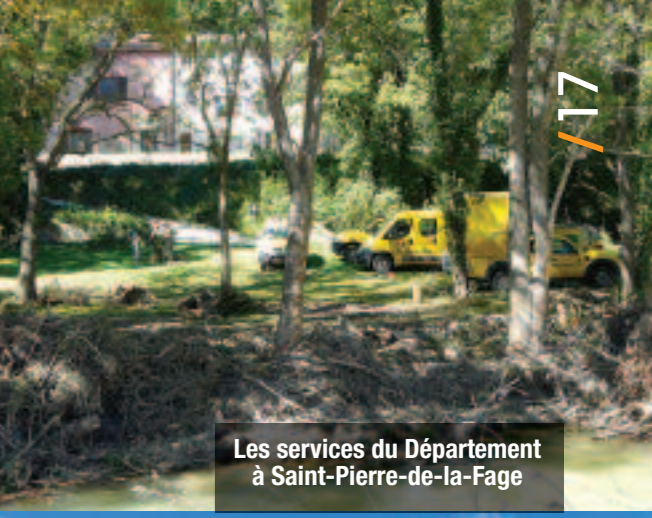
Les services du Département à Saint-Pierre-de-la-Fage