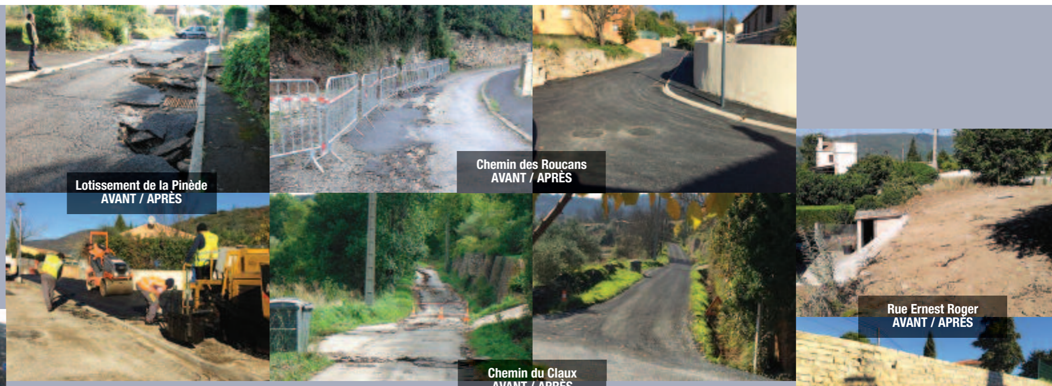
Lotissement de la Pinède AVANT / APRES

Pour financer ces travaux, la Ville de Lodève a monté plusieurs dossiers de demande de subvention. Elle espère obtenir : / 12 % de la Région Languedoc-Roussillon / 20 % du Département de l'Hérault / 48 % de l'État dans le cadre du fonds de solidarité / calamités publiques SOIT UN TOTAL DE 80 % DE SUBVENTIONS Le reste sera financé par un emprunt