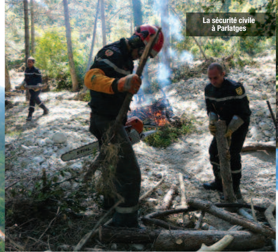
La sécurité civile à Parlatges