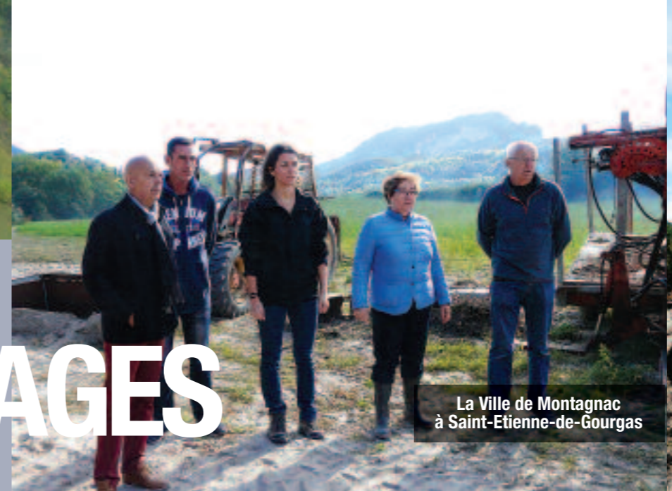
La Ville de Montagnac à Saint-Etienne-de-Gourgas