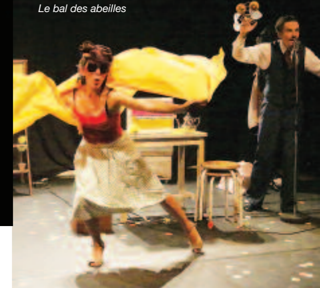
Le bal des abeilles

/ jeudi 7 avril CONCERT SOUS LA PEAU DES FILLES Cie Entre deux caisses 19h / Salleles-du-Bosc