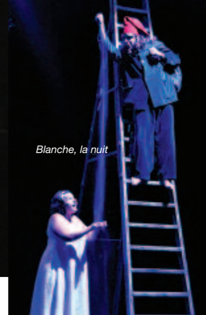
Blanche, la nuit

/ samedi 30 janvier MARIONNETTES VOUS VOULEZ RIRE Cie Les Frères Duchoc 14h15 / Lodève (Théâtre Luteva)