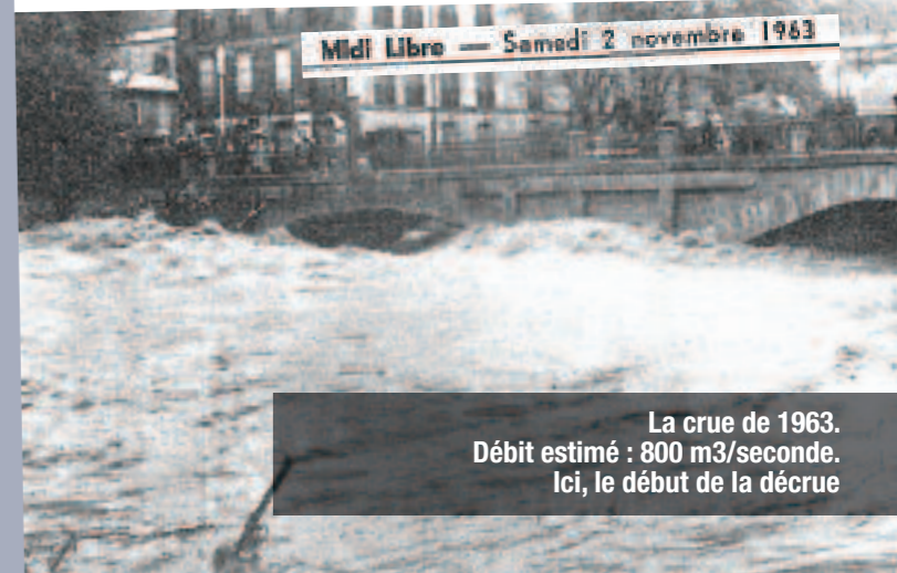
La crue de 1963. Débit estimé : 800 m 3 /seconde. Ici, le début de la décrue

L'intensité des précipitations a accentué le phénomène de ruissellement dans le centre de Lodève.