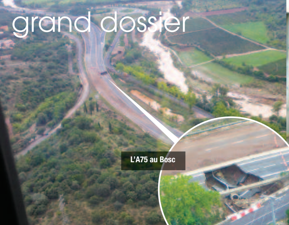
L'A75 au Bosc