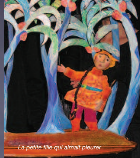
La petite fille qui aimait pleurer

/ mercredi 6 janvier ÇÉRÉMONIE DES VŒUX À LA POPULATION 18h / Lodève (salle Ramadier)