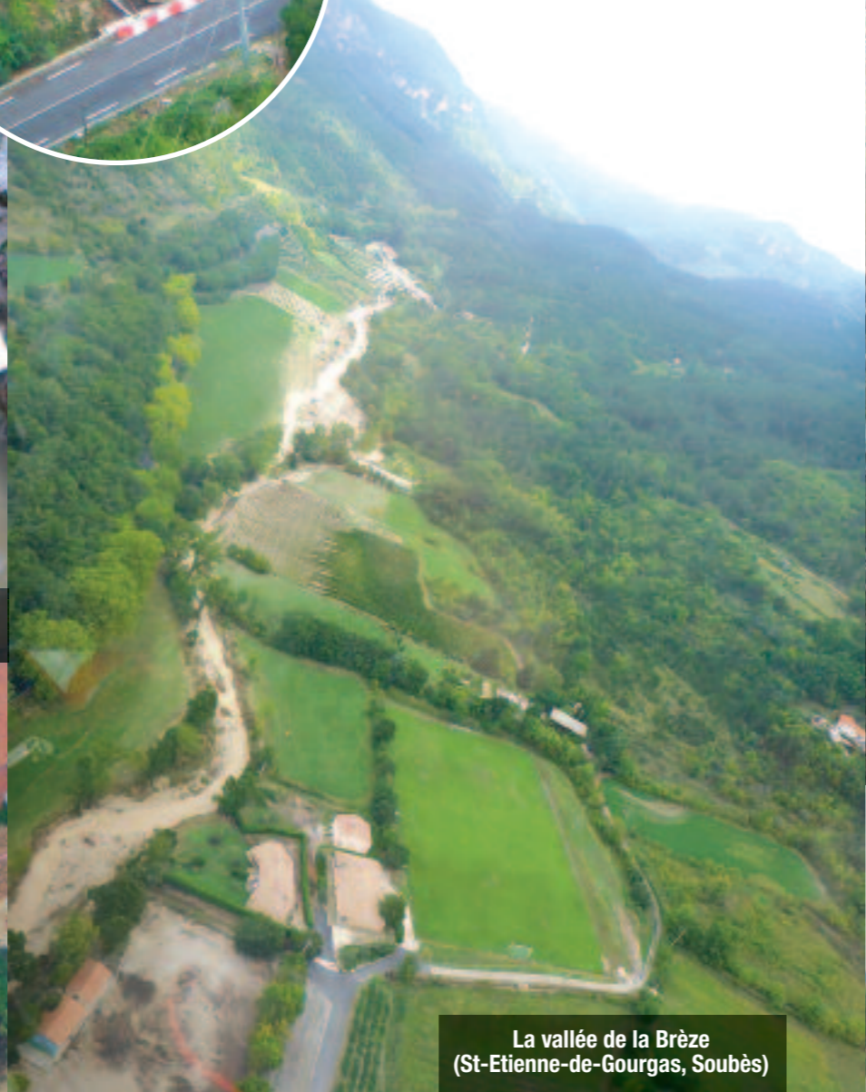
La vallée de la Brèze (St-Etienne-de-Gourgas, Soubès)