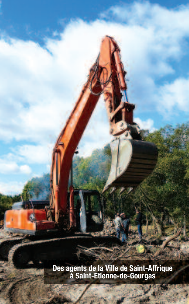
Des agents de la Ville de Saint-Affrique à Saint-Etienne-de-Gourgas

13 septembre 2015 Les photos aériennes sont des images exclusives, prises depuis l'hélicoptère de la Sécurité civile le lendemain des inondations