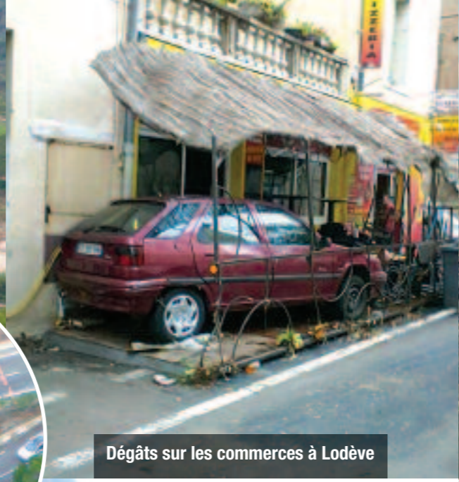
Dégâts sur les commerces à Lodève