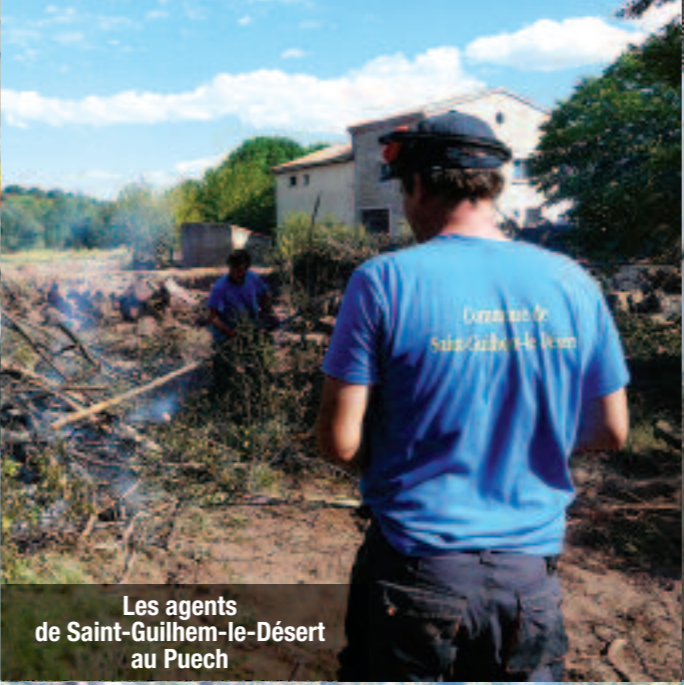
Les agents de Saint-Guilhem-le-Désert au Puech