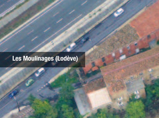
Les Moulinages (Lodève)