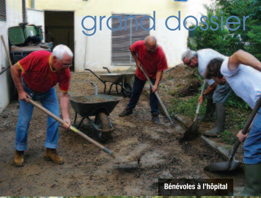
Bénévoles à l'hôpital