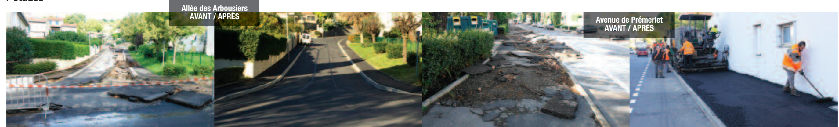
Allée des Arbousiers AVANT / APRES