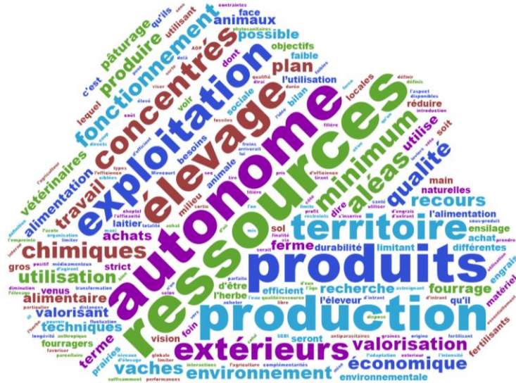
Illustration par un nuage de mots des réponses aux 24 premiers questionnaires reçus ( www.nuagesdemots.fr )