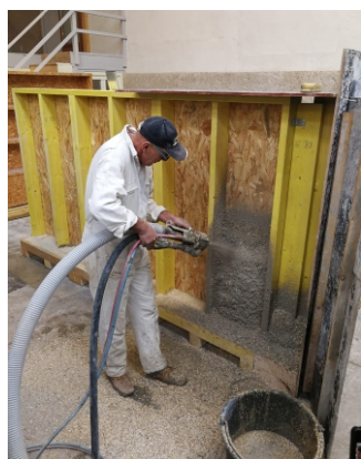
Projection sur ossature bois