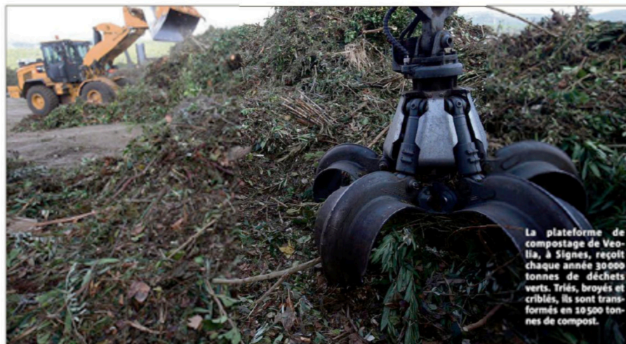
La plateforme de compostage de Veolia, à Signes, reçoit chaque année 30000 tonnes de déchets verts. Triés, broyés et criblés, ils sont transformés en 10 500 tonnes de compost.

« À partir des 20000 tonnes de déchets verts, on produit 10500 tonnes de compost, annonce Laurent Bréissand.